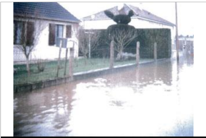
3 chemin des prairies

GÉOLOCALISATION Coordonnées WGS84 : X: 1.13469320 / Y: 49.87920000 Coordonnées RGF93 (Lambert 93) X: 565835.42 / Y: 6977191.75 Coordonnées RGF93 (ETRS89) : X: 1.1346932 / Y: 49.8792 Code Hydro: G2100600 Rive de référence: Droite