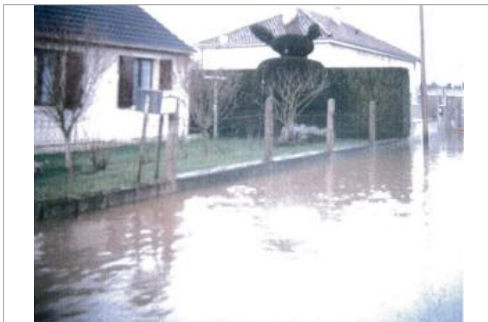
3 chemin des prairies

GÉOLOCALISATION Coordonnées WGS84 : X: 1.13469320 / Y: 49.87920000 Coordonnées RGF93 (Lambert 93) X: 565835.42 / Y: 6977191.75 Coordonnées RGF93 (ETRS89) : X: 1.1346932 / Y: 49.8792 Code Hydro: G2100600 Rive de référence: Droite