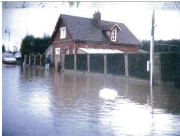
1 chemin des prairies