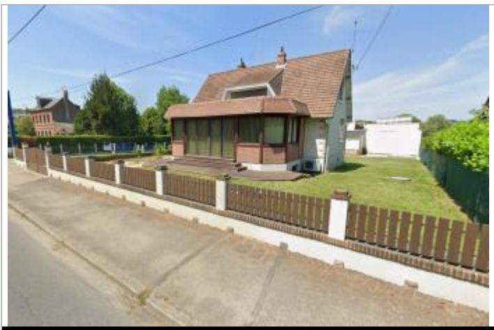
Vue depuis la rue Verdier Moretti.

GÉOLOCALISATION Coordonnées WGS84 : X: 1.13755530 / Y: 49.88137600 Coordonnées RGF93 (Lambert 93) X: 566046.95 / Y: 6977429.05 Coordonnées RGF93 (ETRS89) : X: 1.1375553 / Y: 49.881376 Code Hydro: G2--0200 Rive de référence: Gauche