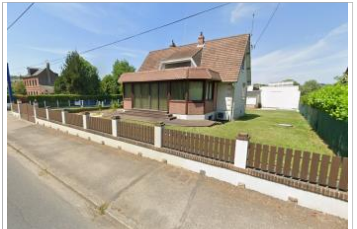
Vue depuis la rue Verdier Moretti.