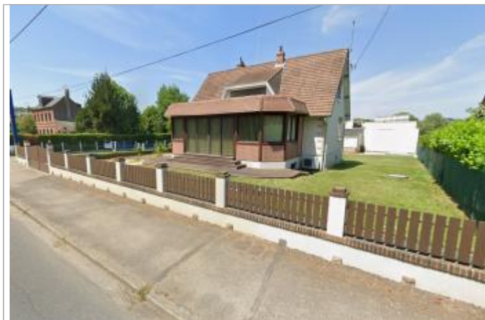
Vue depuis la rue Verdier Moretti.