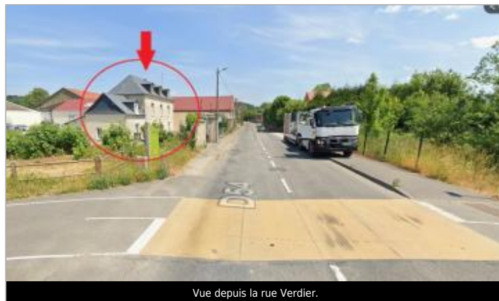
Vue depuis la rue Verdier.