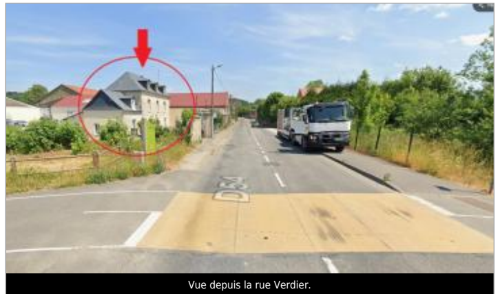
Vue depuis la rue Verdier.

GÉOLOCALISATION Coordonnées WGS84 : X: 1.13453517 / Y: 49.88113890 Coordonnées RGF93 (Lambert 93) X: 565829.15 / Y: 6977407.79 Coordonnées RGF93 (ETRS89) : X: 1.1345352 / Y: 49.8811389 Code Hydro: G2067001 Rive de référence: Gauche