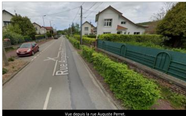
Vue depuis la rue Auguste Perret.

GÉOLOCALISATION Coordonnées WGS84 : X: 1.13617035 / Y: 49.88155070 Coordonnées RGF93 (Lambert 93) X: 565947.82 / Y: 6977450.84 Coordonnées RGF93 (ETRS89) : X: 1.1361704 / Y: 49.8815507 Code Hydro: G2--0200 Rive de référence: Gauche