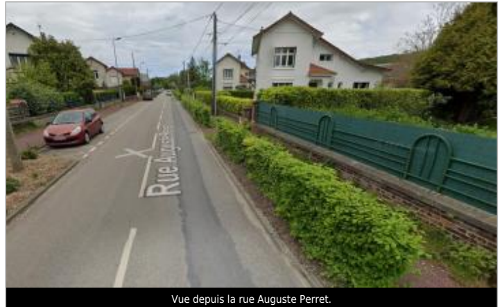
Vue depuis la rue Auguste Perret.