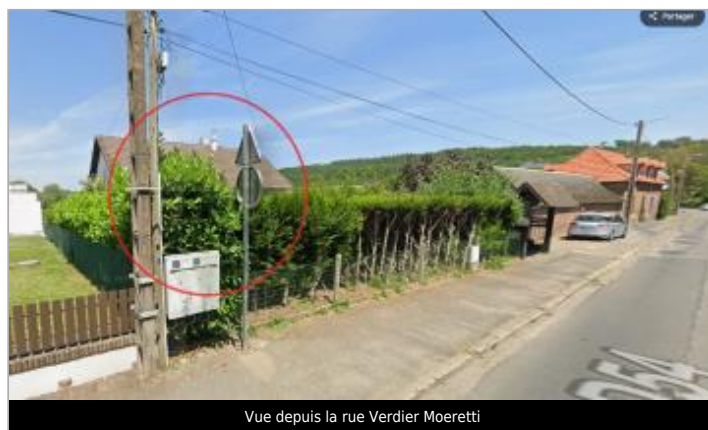
Vue depuis la rue Verdier Moeretti

GÉOLOCALISATION Coordonnées WGS84 : X: 1.13770250 / Y: 49.88154600 Coordonnées RGF93 (Lambert 93) X: 566057.98 / Y: 6977447.72 Coordonnées RGF93 (ETRS89) : X: 1.1377025 / Y: 49.881546 Code Hydro: G2--0200 Rive de référence: Gauche