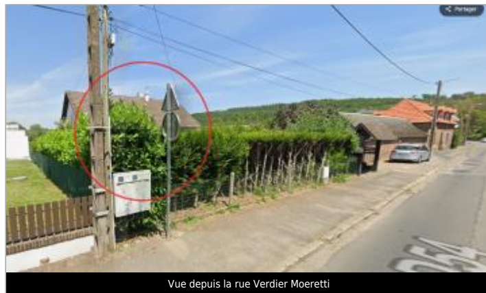
Vue depuis la rue Verdier Moeretti