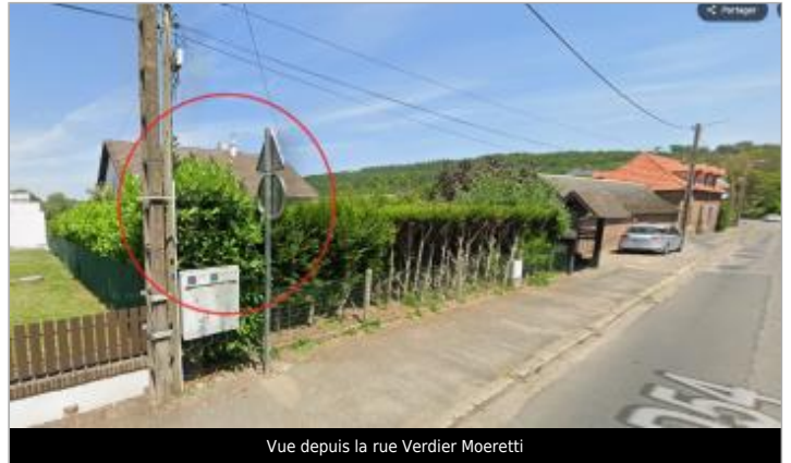
Vue depuis la rue Verdier Moeretti

GÉOLOCALISATION Coordonnées WGS84 : X: 1.13770250 / Y: 49.88154600 Coordonnées RGF93 (Lambert 93) : X: 566057.98 / Y: 6977447.72 Coordonnées RGF93 (ETRS89) : X: 1.1377025 / Y: 49.881546 Code Hydro: G2--0200 Rive de référence: Gauche