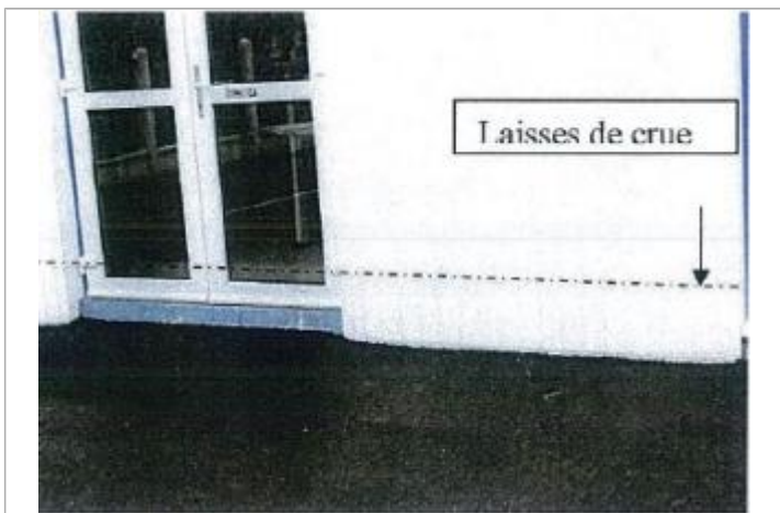
35 Rue Verdier Monetti

GÉNÉRAL Code : WEB_R_201902085434 Date de mise à jour : 04/12/2025 Auteur : SPC.SACN