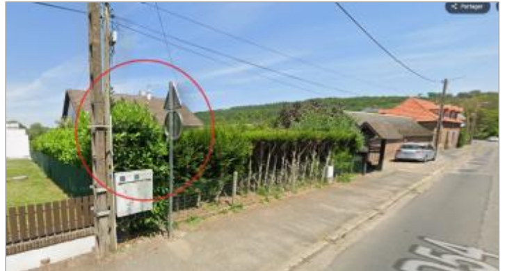
Vue depuis la rue Verdier Moeretti