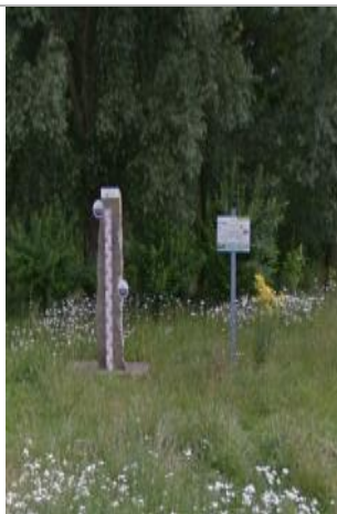
Repère de crue