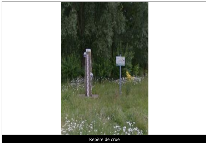
Repère de crue