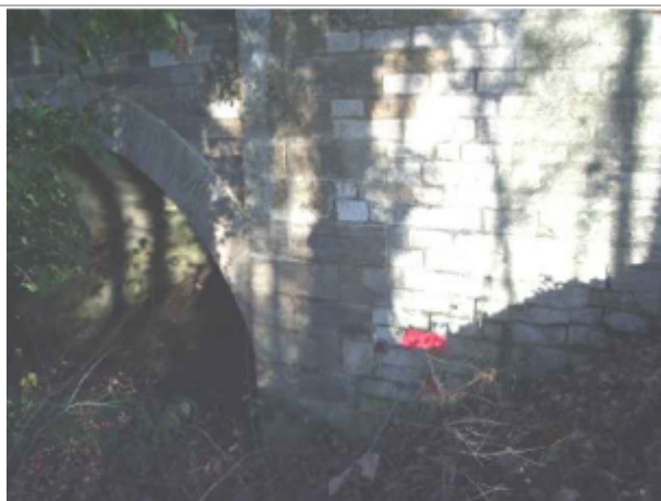
repere de crue au centre de la photo