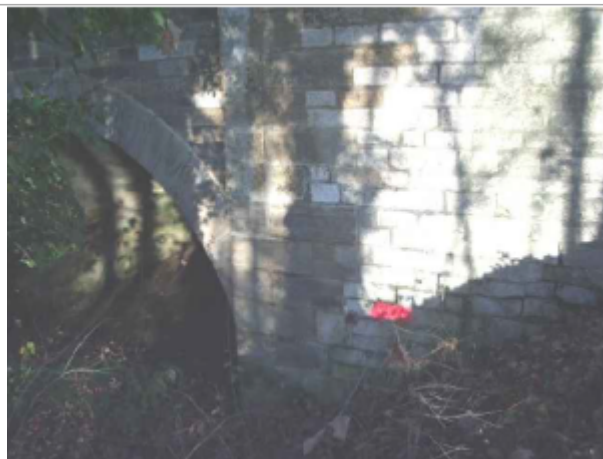
repere de crue au centre de la photo