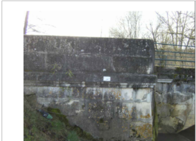
repere de crue au centre de la photo

Coordonnées RGF93 (ETRS89) : X: 5.1579455 / Y: 48.0906887