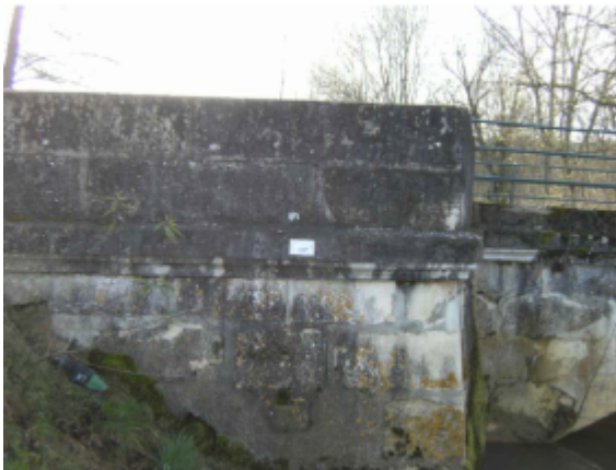
repere de crue au centre de la photo