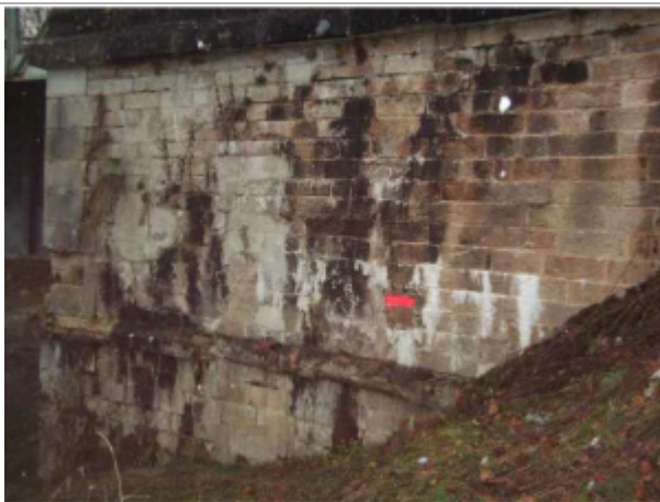
repere de crue au centre de la photo