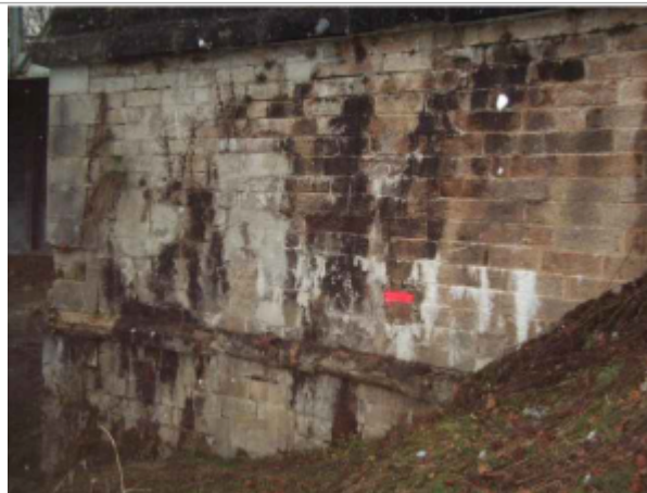
repere de crue au centre de la photo