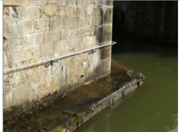
reper de crue au centre de la photo