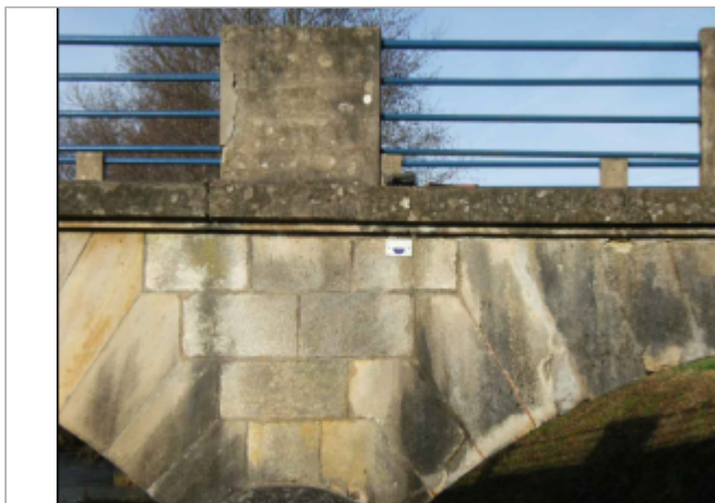
repere de crue au centre de la photo

Coordonnées RGF93 (ETRS89) : X: 5.2690053 / Y: 47.983129