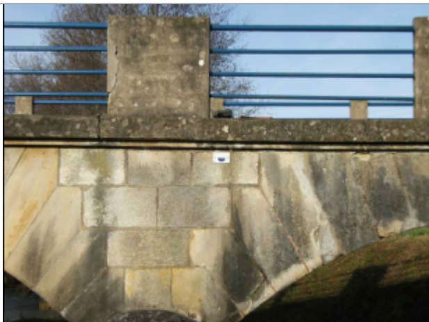
repere de crue au centre de la photo