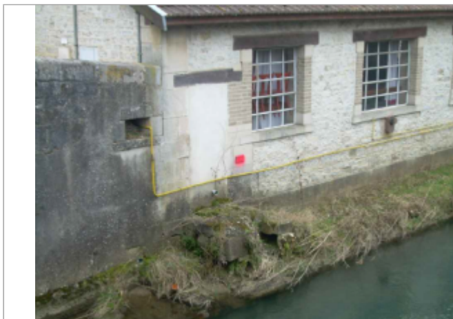
repere de crue au centre de la photo