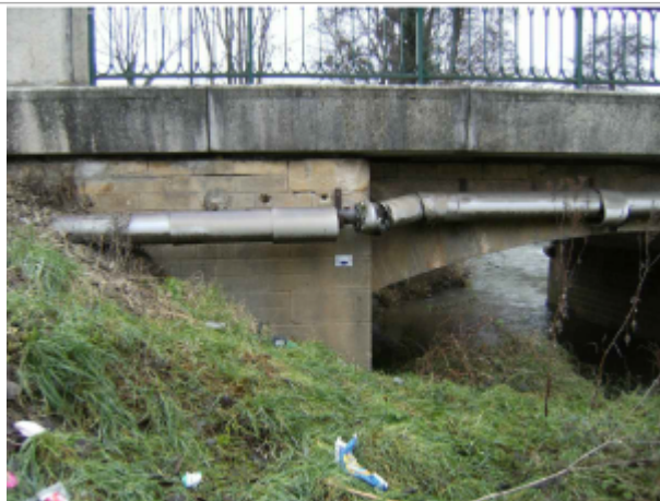
reper de crue au centre de la photo