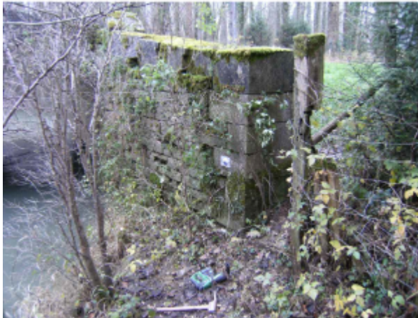
repere de crue au centre de la photo

Altitude calculée de l'eau (en m) : 183.07