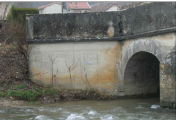
repere de crue au centre de la photo

Altitude calculée de l'eau (en m) : 186.91 m