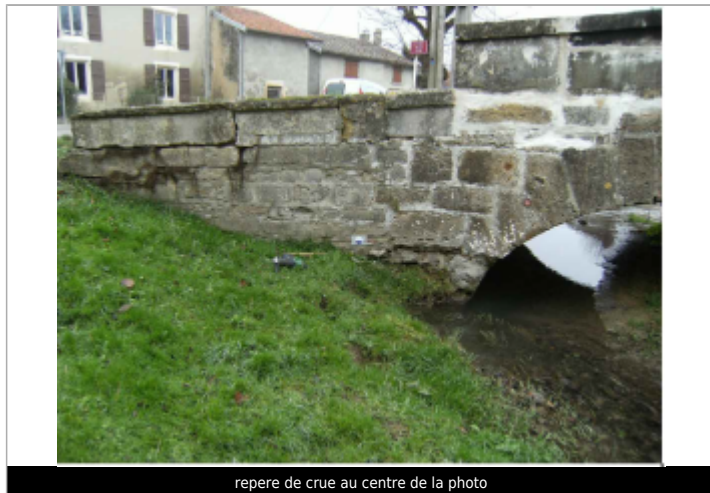
repere de crue au centre de la photo