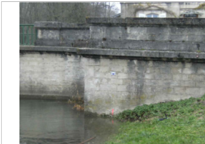
repere de crue au centre de la photo