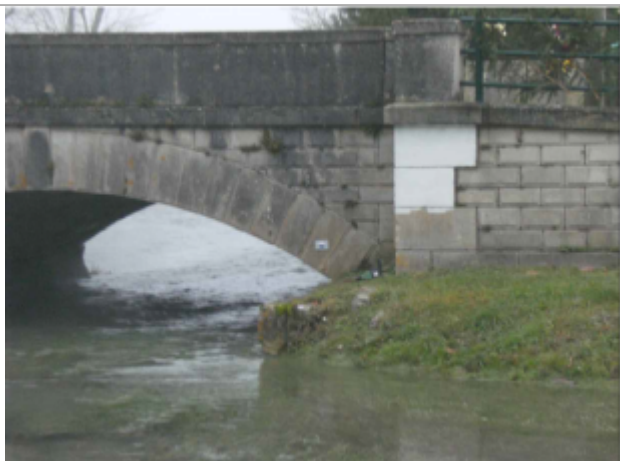
repere de crue au centre de la photo

Altitude calculée de l'eau (en m) : 232.42