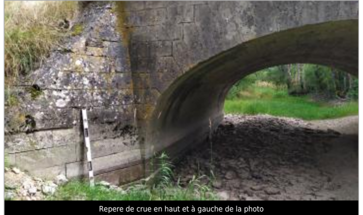
Repere de crue en haut et à gauche de la photo