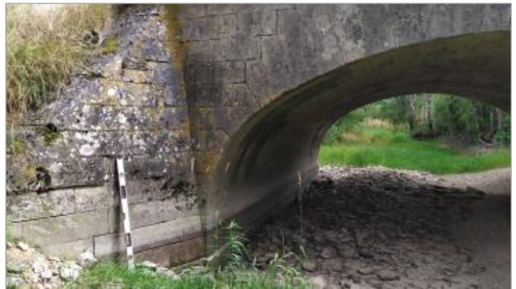
Repere de crue en haut et à gauche de la photo

Coordonnées RGF93 (ETRS89) : X: 4.9755765 / Y: 48.2744367