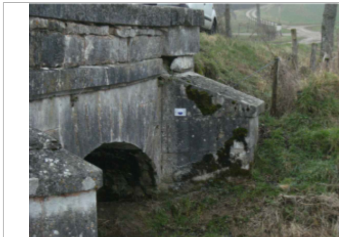
repere de crue au centre de la photo