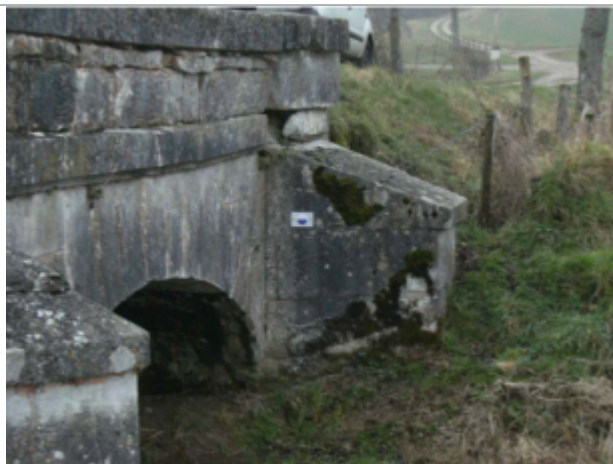
repere de crue au centre de la photo

Altitude calculée de l'eau (en m) : 269.01 m