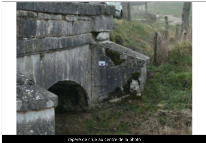
repere de crue au centre de la photo