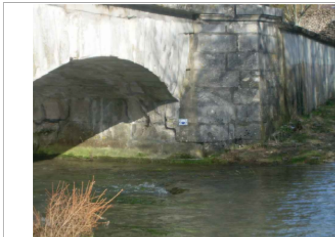
repere de crue au centre de la photo