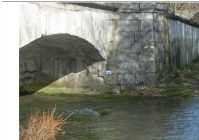
repere de crue au centre de la photo