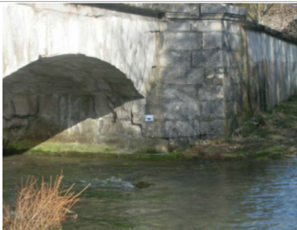
repere de crue au centre de la photo

Altitude calculée de l'eau (en m) : 292.54 m