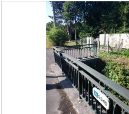
Ouvrage d'art sur la RD916