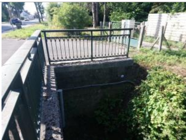
Repère de crue en rive droite de la Grande Steenbecque