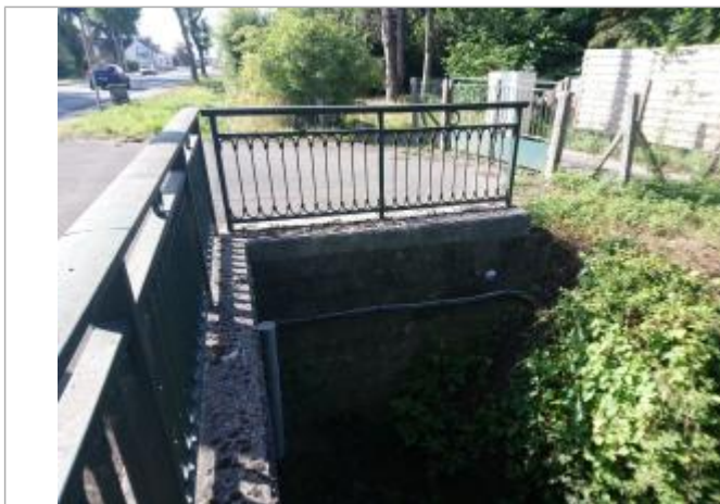
Repère de crue en rive droite de la Grande Steenbecque