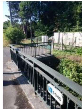
Ouvrage d'art sur la RD916

Coordonnées RGF93 (ETRS89) : X: 2.5112968 / Y: 50.683373