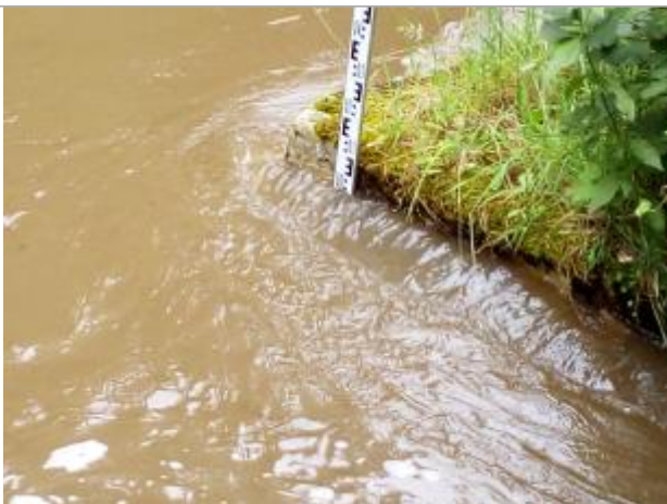
Niveau de l'eau au pic de la crue

Altitude calculée de l'eau (en m) : 58.27 m