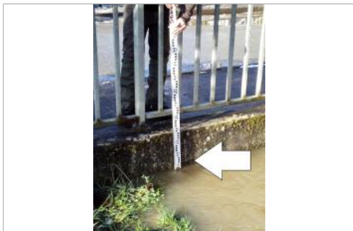
Marque d'humidité sur la face aval du pont.

Altitude calculée de l'eau (en m) : 56.37 m