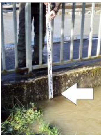
Marque d'humidité sur la face aval du pont.

Altitude calculée de l'eau (en m) : 56.37 m