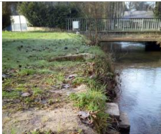
Pont de la Boissière à Breuillet (91)