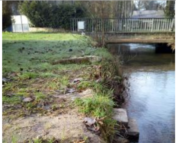
Pont de la Boissière à Breuillet (91)

Coordonnées WGS84 : X: 2.15330030 / Y: 48.57726400