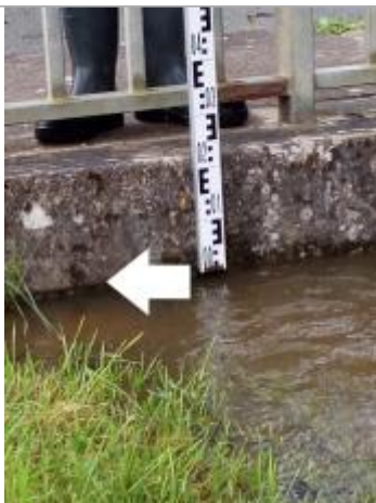
Marque de la laisse et position de la mire mesurant la différence entre le niveau max de la crue et le dessus du rebord du pont.

Altitude calculée de l'eau (en m) : 56.45 m