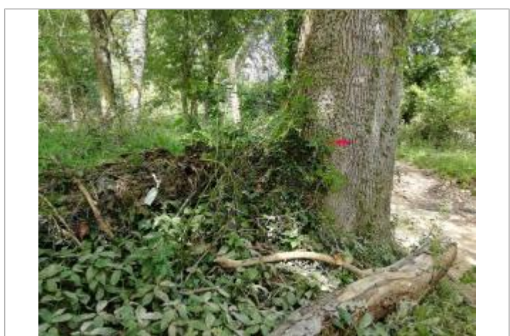
Vue sur la marque peinte de l'arbre et le feuillage sur le grillage

GÉNÉRAL Code : WEB_R_201901163303 Date de mise à jour : 16/01/2019 Auteur : Ghubert