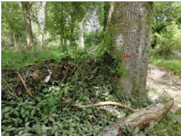
Vue sur la marque peinte de l'arbre et le feuillage sur le grillage