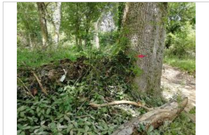
Vue sur la marque peinte de l'arbre et le feuillage sur le grillage

GÉNÉRAL Code : WEB_R_201901163303 Date de mise à jour : 16/01/2019 Auteur : Ghubert