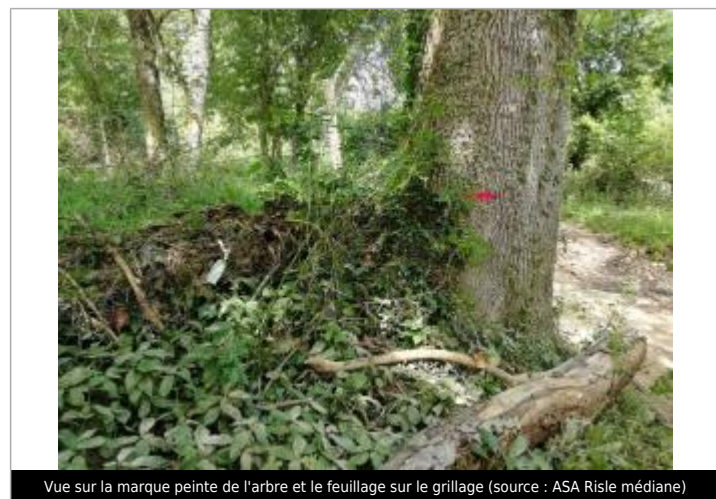
Vue sur la marque peinte de l'arbre et le feuillage sur le grillage