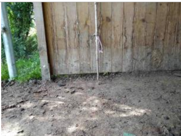
Vue sur la trace de sédiments sur la grange en bois