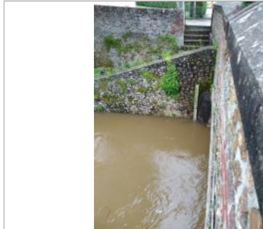
Vue sur l'échelle en rive droite, en aval du pont