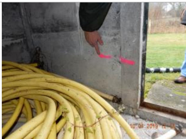
Vue à l'intérieur du local