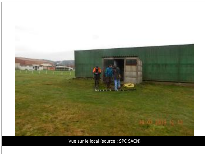
Vue sur le local