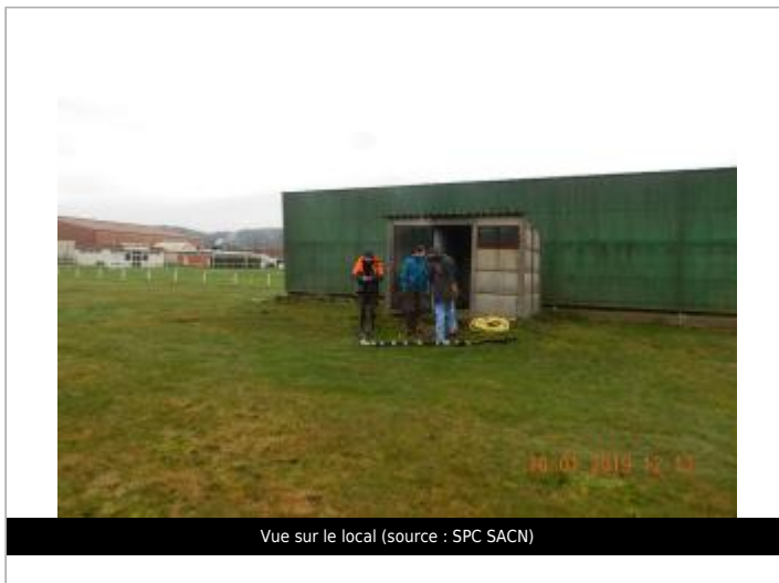
Vue sur le local