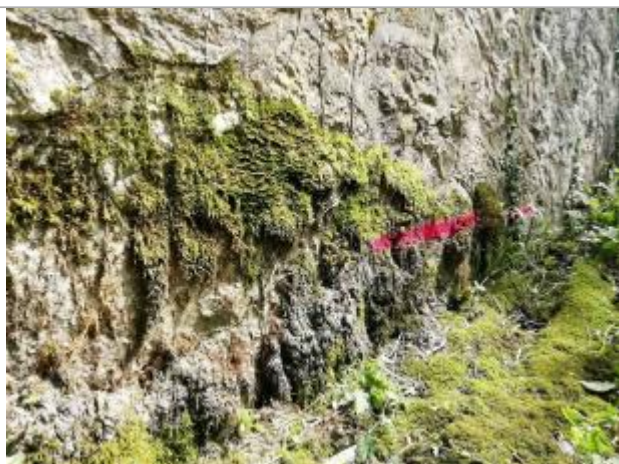
Vue sur la marque au bas de la pile rive droite

Altitude calculée de l'eau (en m) : 103.15 m