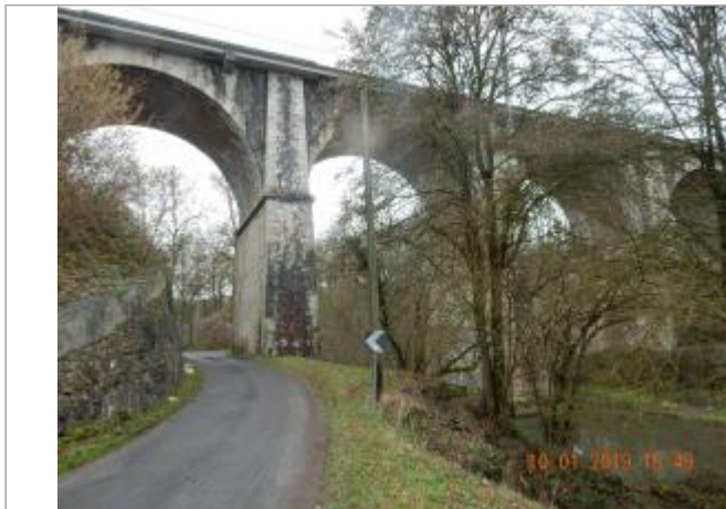
Vue sur le viaduc depuis l'aval