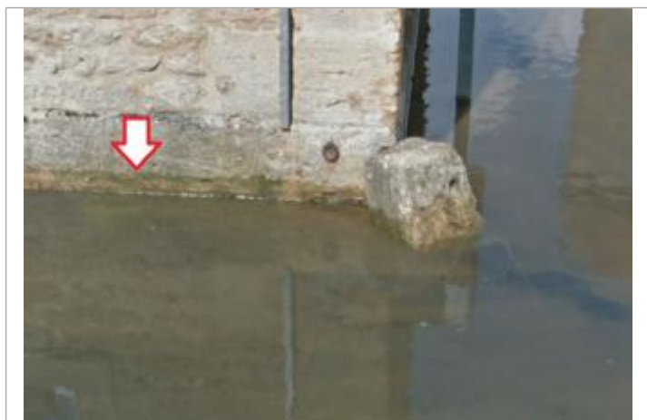
Vue du repère

Visibilité : Non État du repère : Disparu Pérennité : Aucune