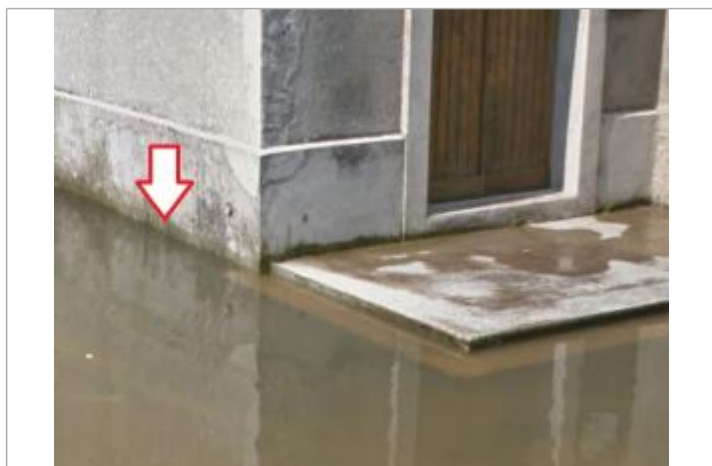
Vue du repère