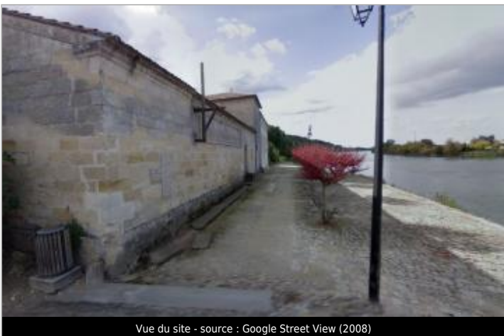
Vue du site - source : Google Street View (2008)

GÉOLOCALISATION Coordonnées WGS84 : X: -0.18858440 / Y: 44.83202800 Coordonnées RGF93 (Lambert 93) X: 448056.67 / Y: 6419850.29 Coordonnées RGF93 (ETRS89) : X: -0.1885844 / Y: 44.832028 Code Hydro: P---0000 Rive de référence: Gauche