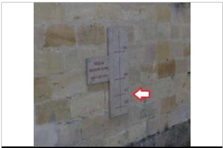
Vue du repère - Source : Google Street View (2008)

MARQUE Texte : 1912 ? Maximum de l'inondation : Oui