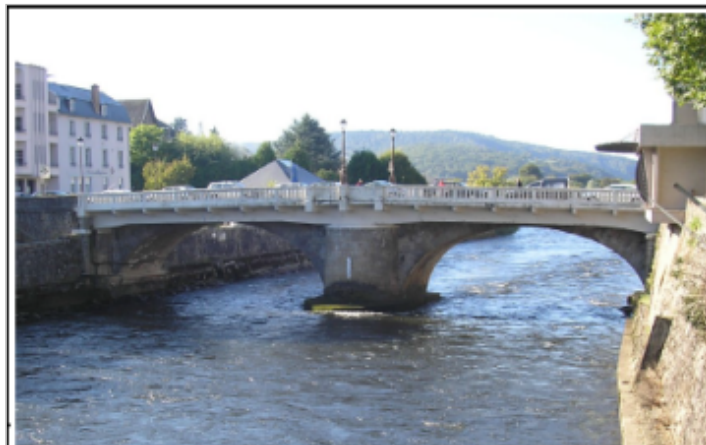
Le Pont Vieux