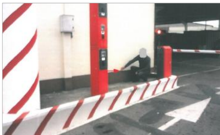
laisse de crue à 35 cm/sol