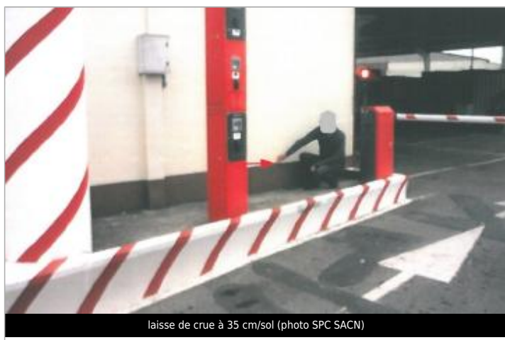
laisse de crue à 35 cm/sol