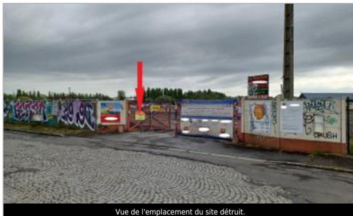
Vue de l'emplacement du site détruit.