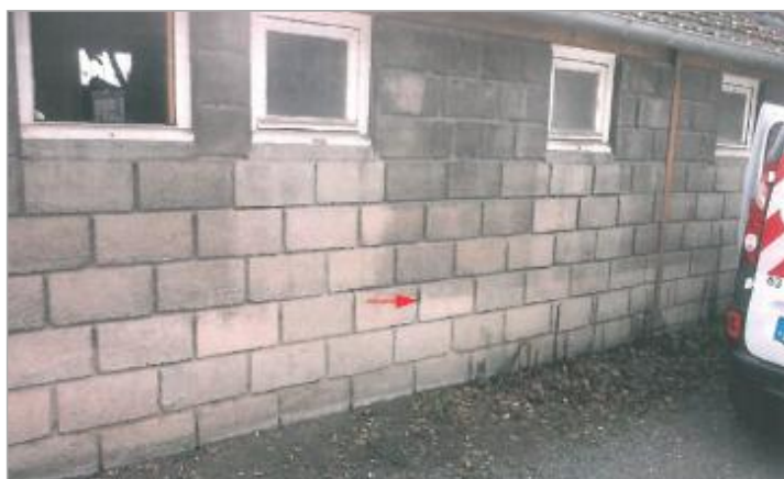
Locaux ferroviaires - Cours Montalivet