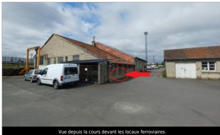
Vue depuis la cours devant les locaux ferroviaires.