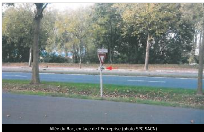
Allée du Bac, en face de l'Entreprise