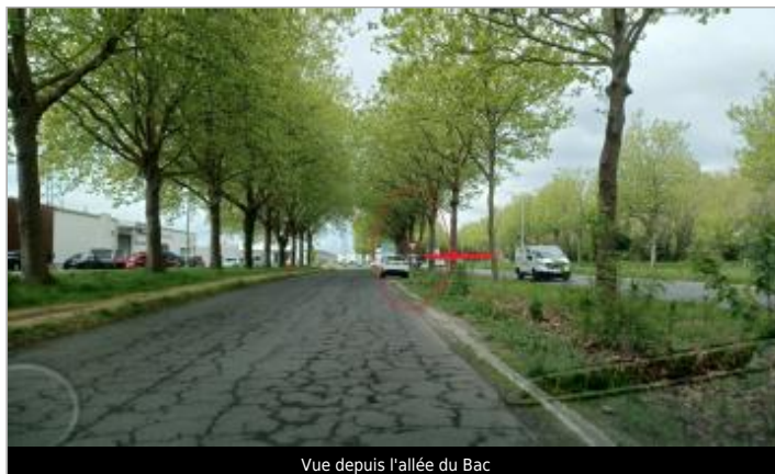
Vue depuis l'allée du Bac