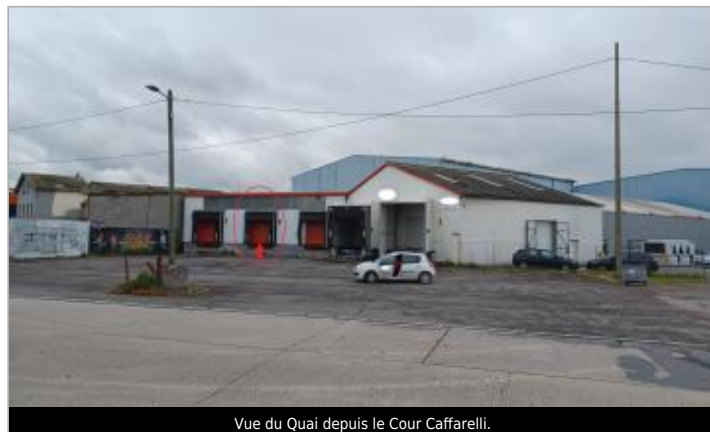
Vue du Quai depuis le Cour Caffarelli.

Coordonnées WGS84 : X: -0.33054000 / Y: 49.18103000