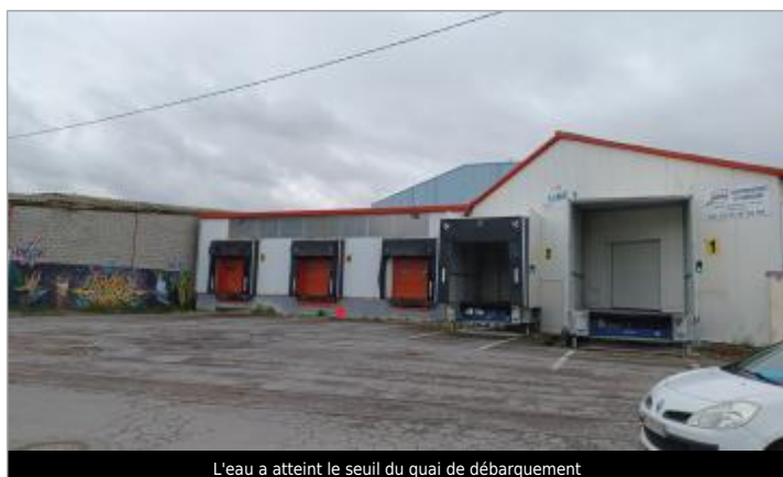
L'eau a atteint le seuil du quai de débarquement