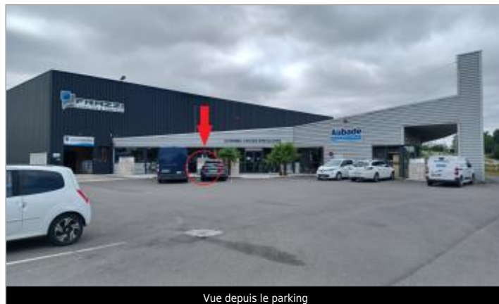
Vue depuis le parking

Coordonnées WGS84 : X: -0.32056980 / Y: 49.18198700