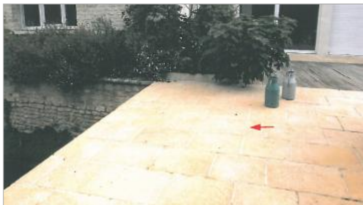
Moulin au bout de l'impasse du Dan - Passerelle amont