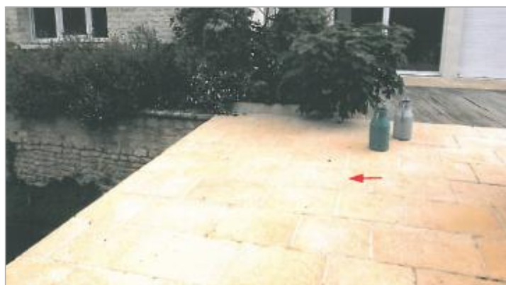
Moulin au bout de l'impasse du Dan - Passerelle amont