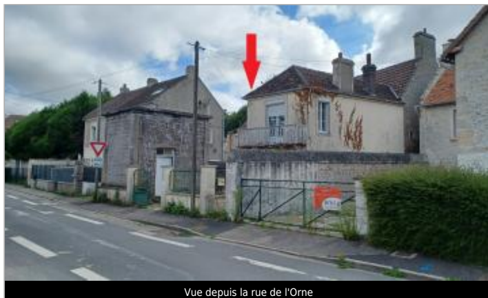
Vue depuis la rue de l'Orne