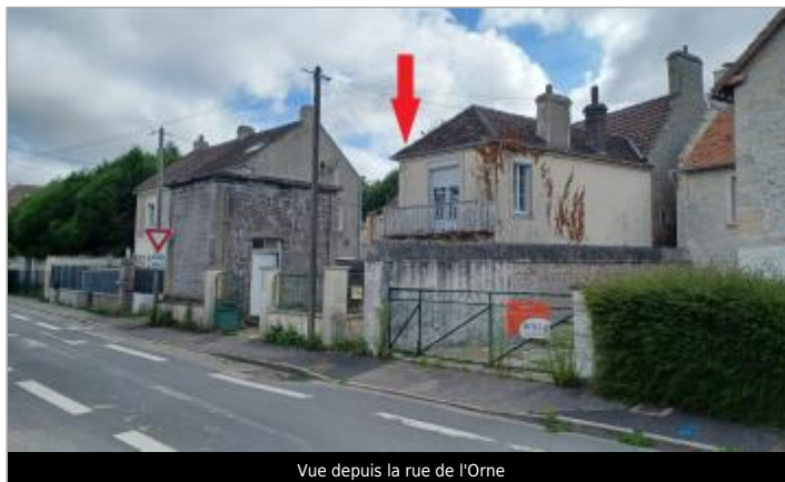
Vue depuis la rue de l'Orne