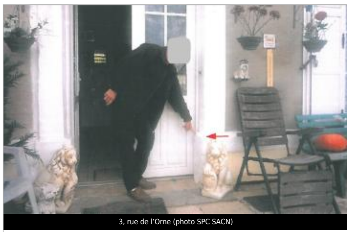
3, rue de l'Orne (photo SPC SACN)

SOURCE DE REPÉRAGE : CARTOGRAPHIE DES NIVEAUX SUR L'ORNE AVAL - 01/01/2015