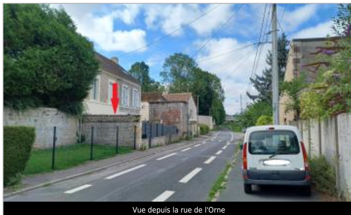
Vue depuis la rue de l'Orne