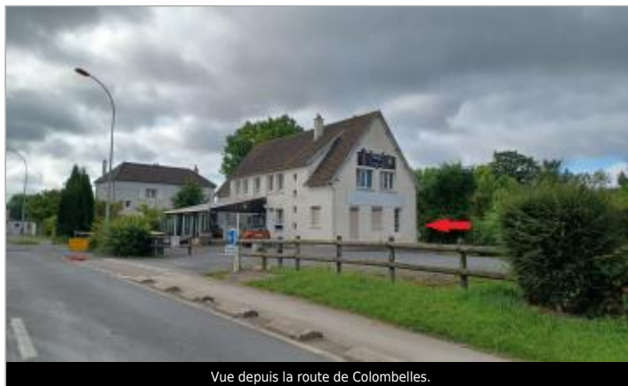
Vue depuis la route de Colombelles.