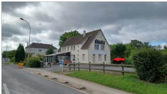
Vue depuis la route de Colombelles.

Coordonnées WGS84 : X: -0.31607890 / Y: 49.20665200