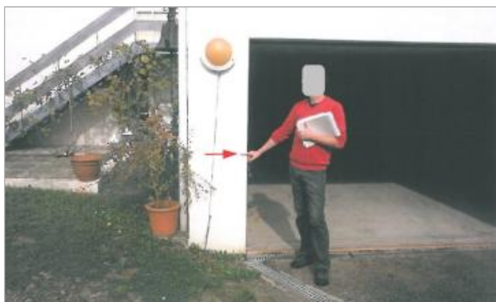
laisse de crue à 1m /sol