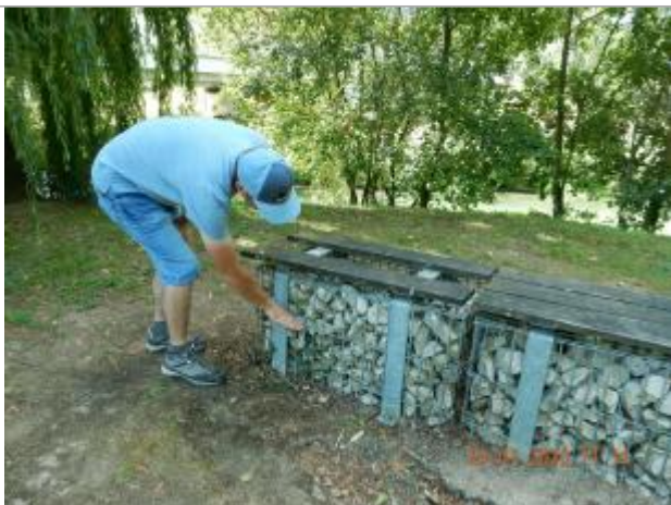
Laisse de crue sur gabion

Altitude calculée de l'eau (en m) : 153.83