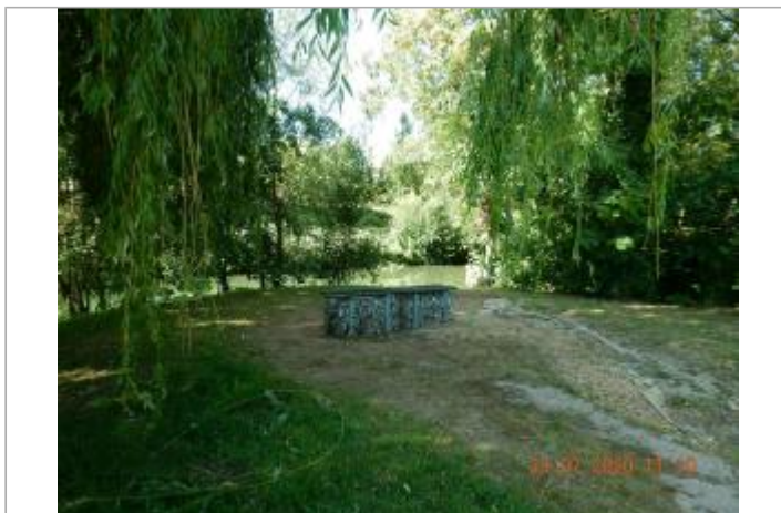
Parc, face à la base de canoës