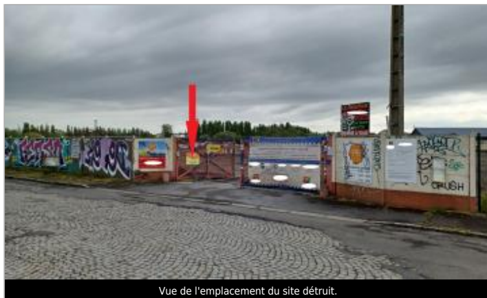
Vue de l'emplacement du site détruit.